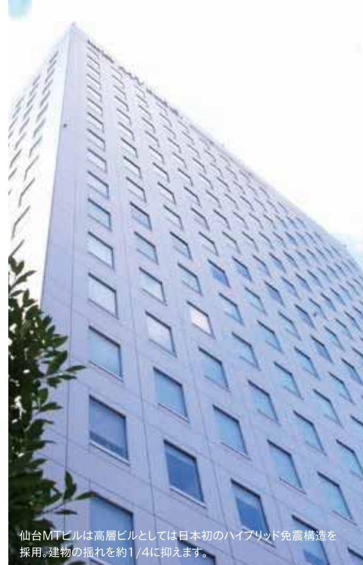
仙台MTビルは高層ビルとしては日本初のハイブリッド免震構造を採用。建物の揺れを約1/4に抑えます。